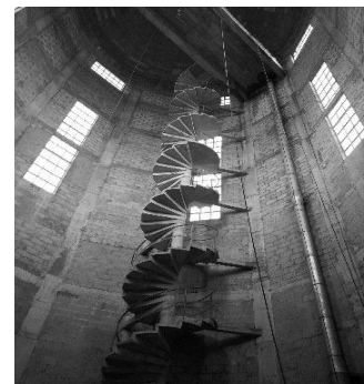
Intérieur du château d'eau de Charrey

Elle est ensuite conduite par un réseau de transfert jusqu'au château d'eau