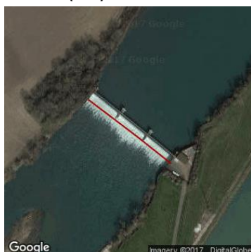
nouveau barrage de Pagny-Seurre et nouvelle écluse de Seurre